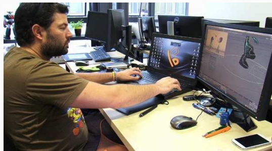
Animateur/trice 2D et 3D