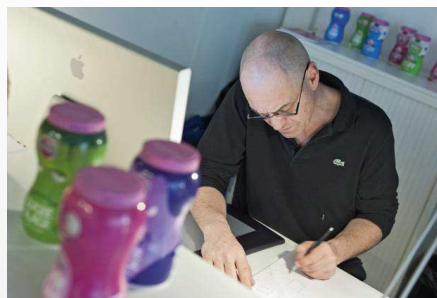
Concepteur/trice designer packaging